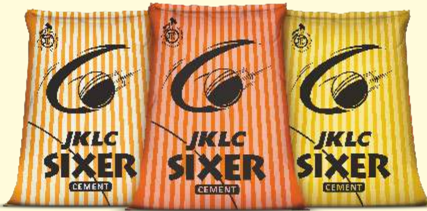
ऑर्डिनरी पोर्टलैंड सीमेंट [ 53 ग्रेड ]